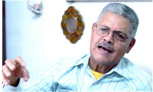
Ambientalista afirma planta se instaló violando las normativas legales.

Otro de los efectos registrados que los residentes en las zonas circundantes a las barcazas más sienten son los ruidos y las