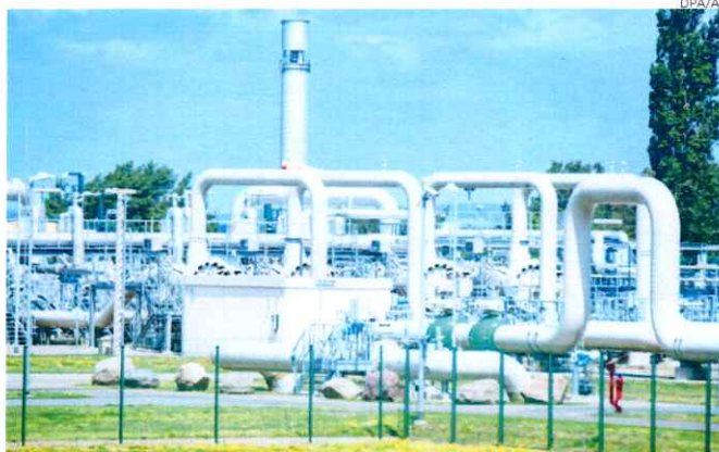
Sistemas de tuberías y válvulas en una estación receptora de gas del gasoducto de Rusia Nord Stream 1 en Lubmin, Alemania, que este lunes cesó los suministros.

El Gobierno alemán no quiso especular sobre lo que pasará después del día 21, fecha oficial en la que deberían acabar las tareas de mantenimiento y quedar restablecido el flujo de gas ruso, aunque reconoció que la situación es "tensa" y "muy seria".