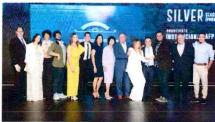
Participantes en la campaña que promocionaba valores.

La publicidad, ejecutada por la agencia Cazar3, obtuvo plata en la categoría de "Seasonal Marketing" y bronce en "Ex-