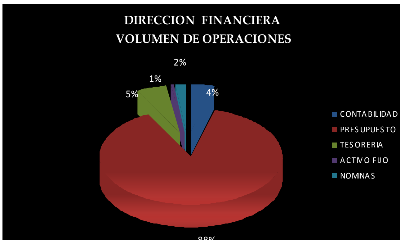
No. 1.